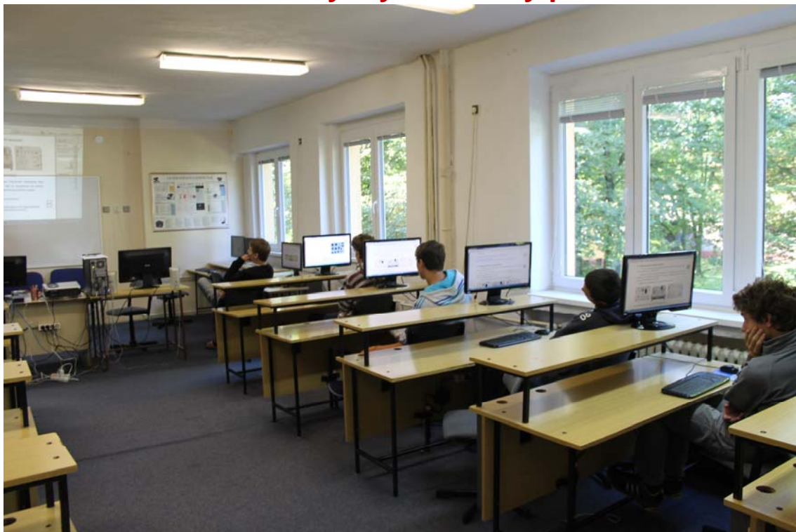
Fotografie z výuky (18. 9. 2013) – skupina žáci naší školy (1. NE)