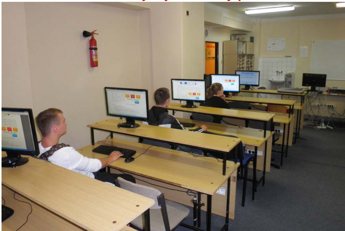
Fotografie z výuky (6. 9. 2013) – skupina žáci naší školy (3. EA)