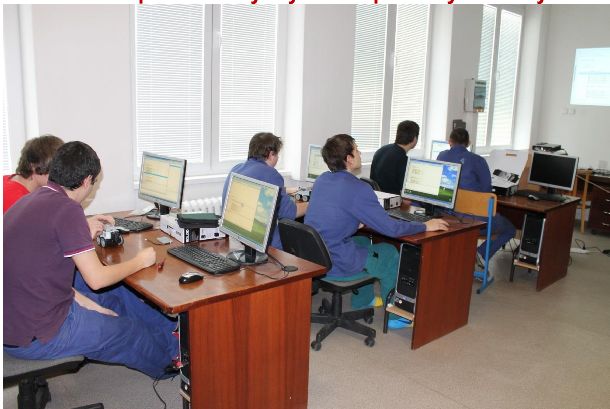
Fotografie z výuky – (4. 4. 2013) – žáci naší školy. Programování jednotlivých funkcí vozítek.