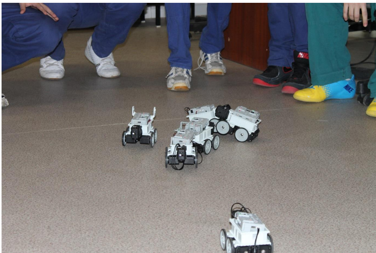
Fotografie z výuky – (5. 4. 2013) – žáci naší školy. „Souboj“ vozítek.