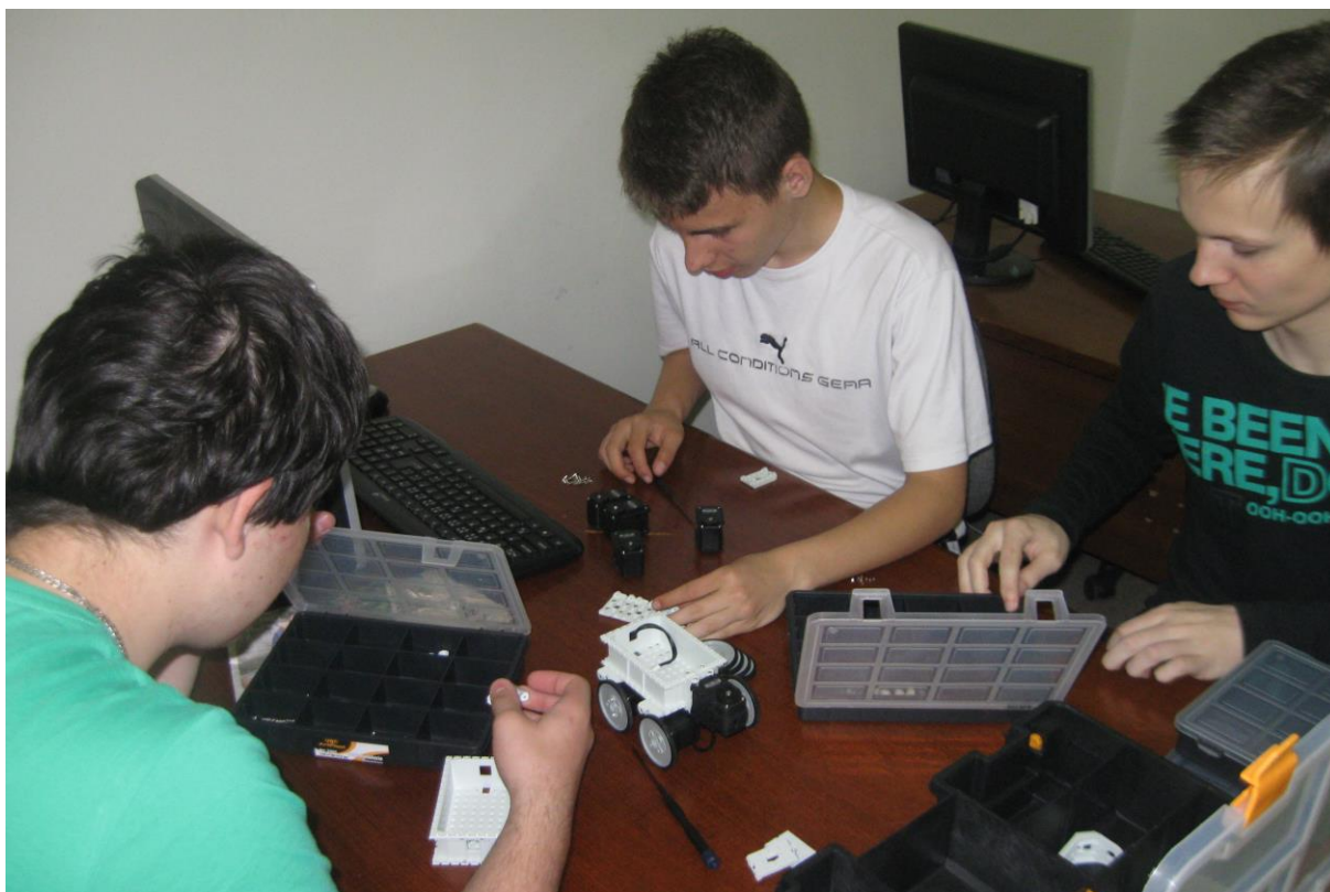
Fotografie z výuky – (6. 6. 2013) – žáci naší školy. Montáž vozítek.