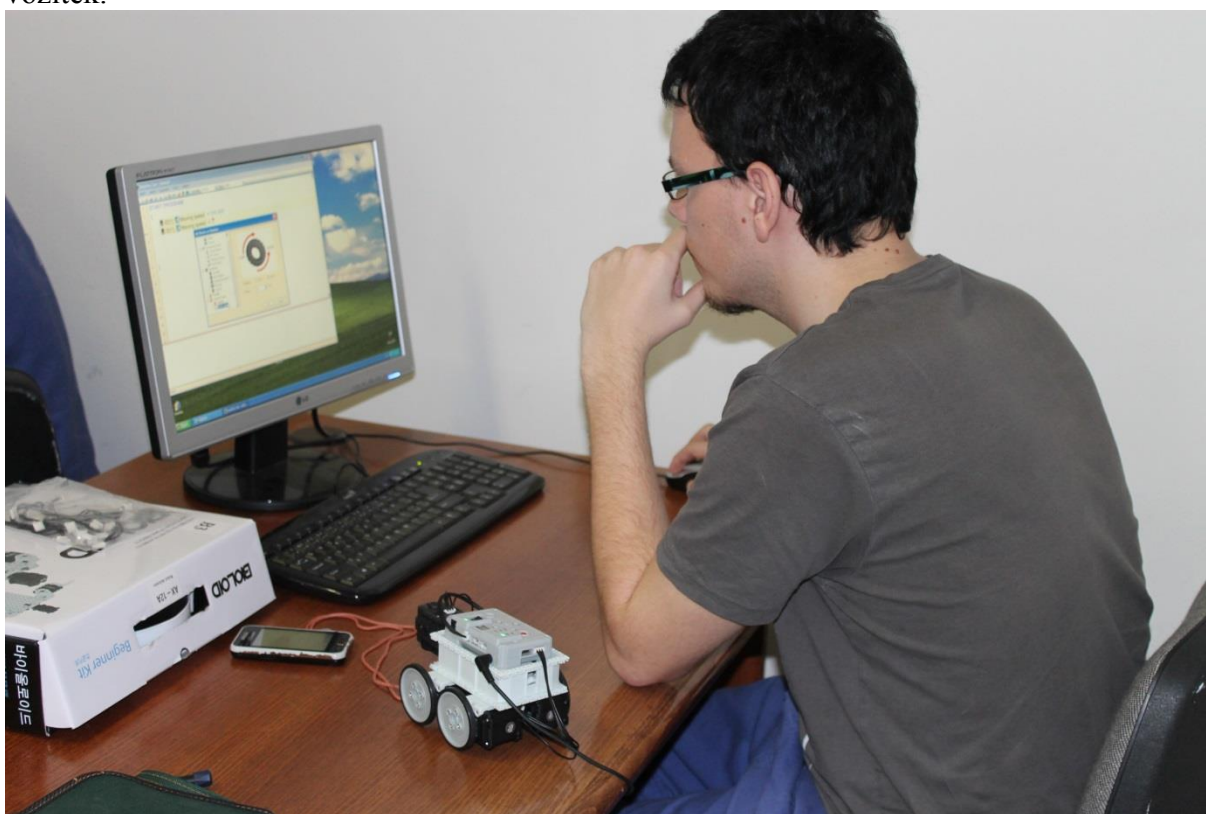
Fotografie z výuky – (4. 4. 2013) – žáci naší školy. Programování jednotlivých funkcí vozítek.