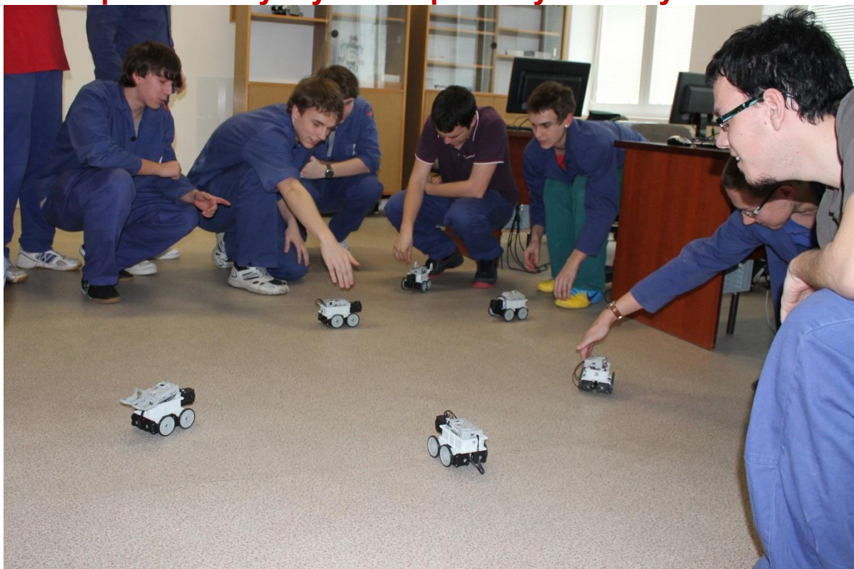
Fotografie z výuky – (5. 4. 2013) – žáci naší školy. „Souboj“ vozítek.