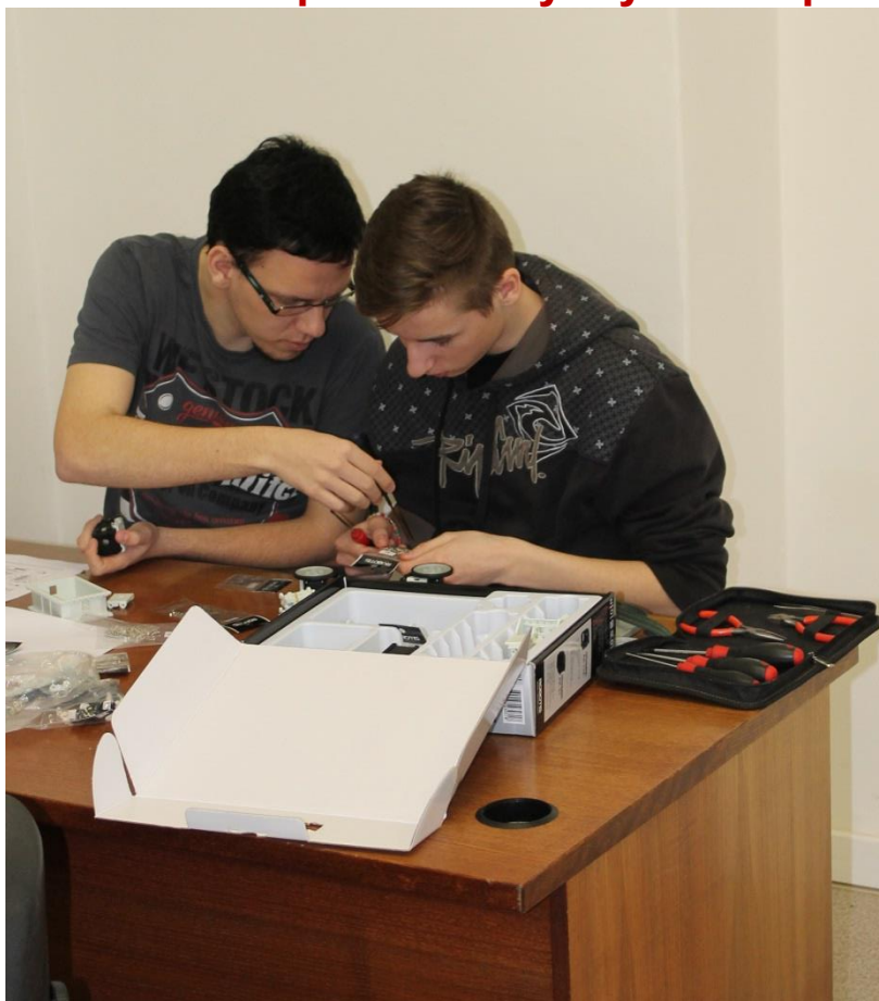
Fotografie z výuky – (3. 4. 2013) – žáci naší školy. Montáž vozítek.