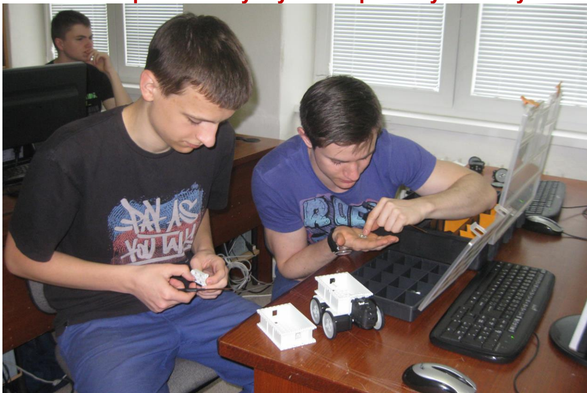
Fotografie z výuky – (6. 6. 2013) – žáci naší školy. Montáž vozítek.