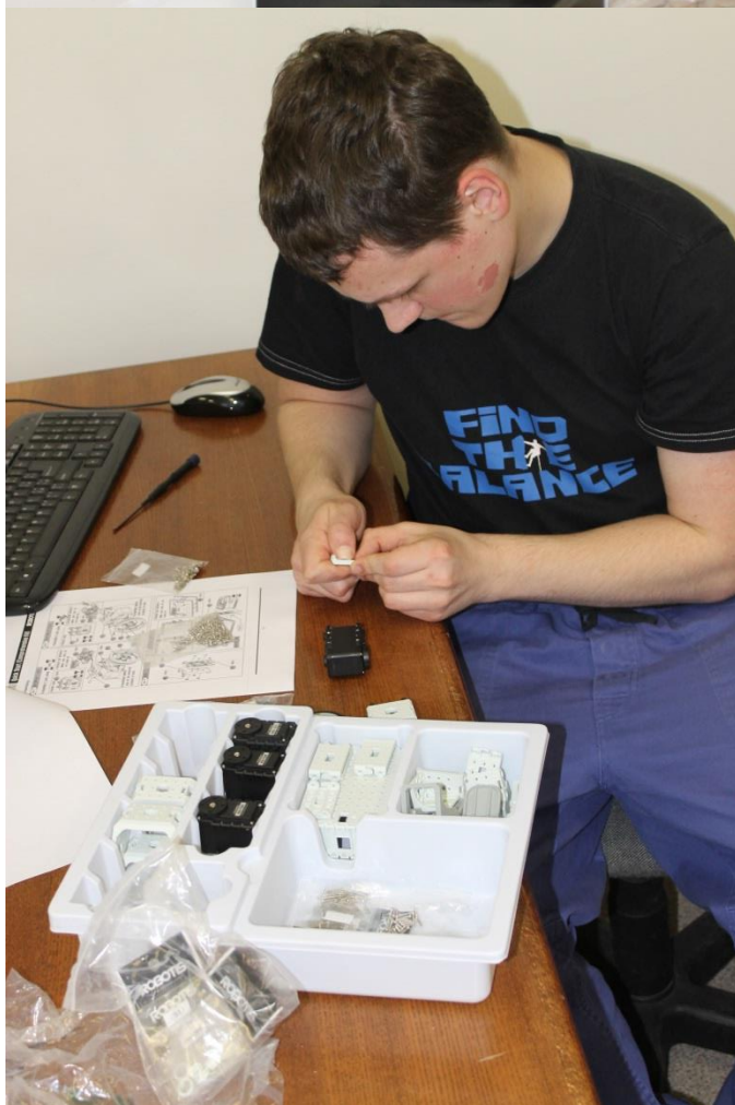
Fotografie z výuky – (3. 4. 2013) – žáci naší školy. Montáž vozítek.