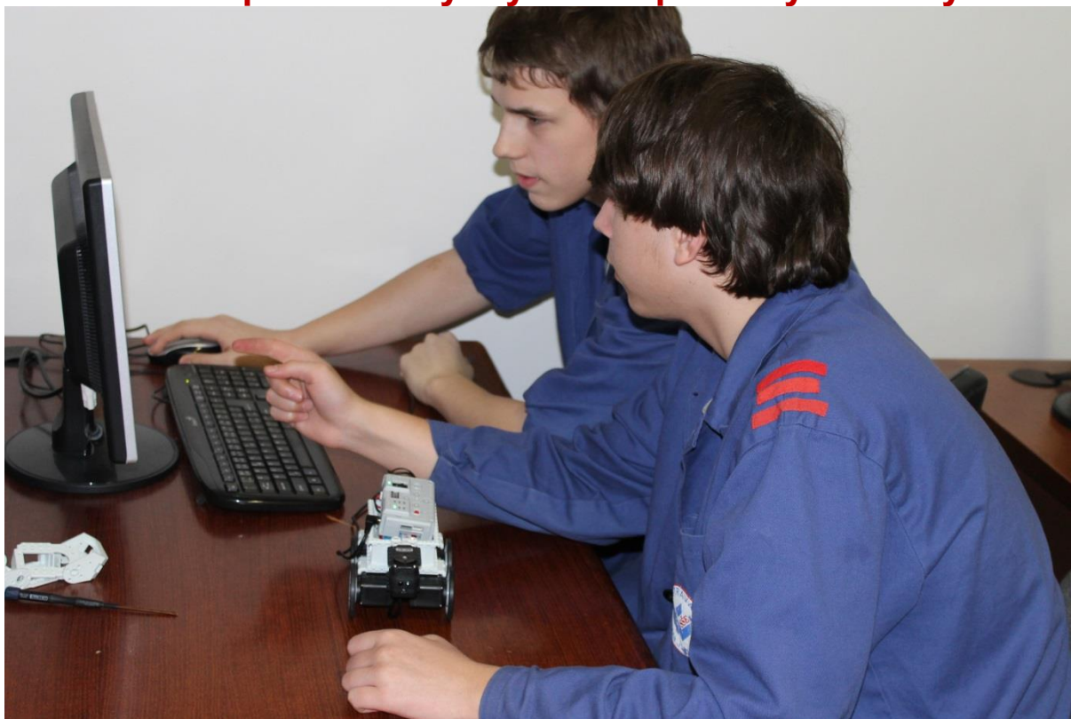
Fotografie z výuky – (4. 4. 2013) – žáci naší školy. Programování jednotlivých funkcí vozítek.